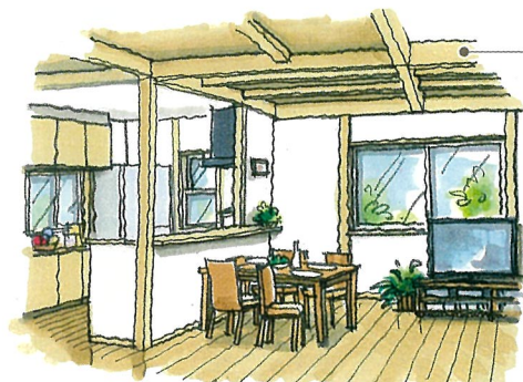
ダイニング キッチン

お料理中でも対面カウンター越しに 家族との会話がはずむ楽しい空間。 自然の温もりに満ちています。